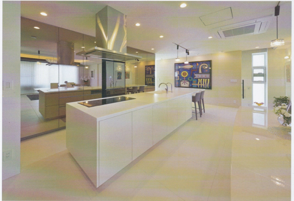
右ページの邸宅のキッチンと外観。1階はインナーガレージで車4台を格納できる。オーダーメイドのアイランドキッチンに鏡貼りのキッチンボードが美しい