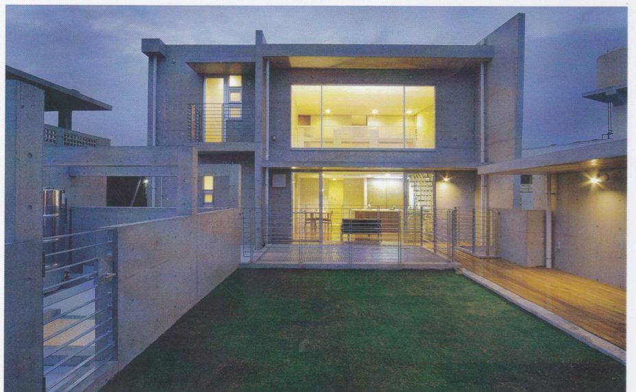
2世帯住宅の施工例。親世帯となる1階屋上にウッドデッキと芝生を配し、2階に住む子世帯住居のセカンドリビングとして有効に活用している