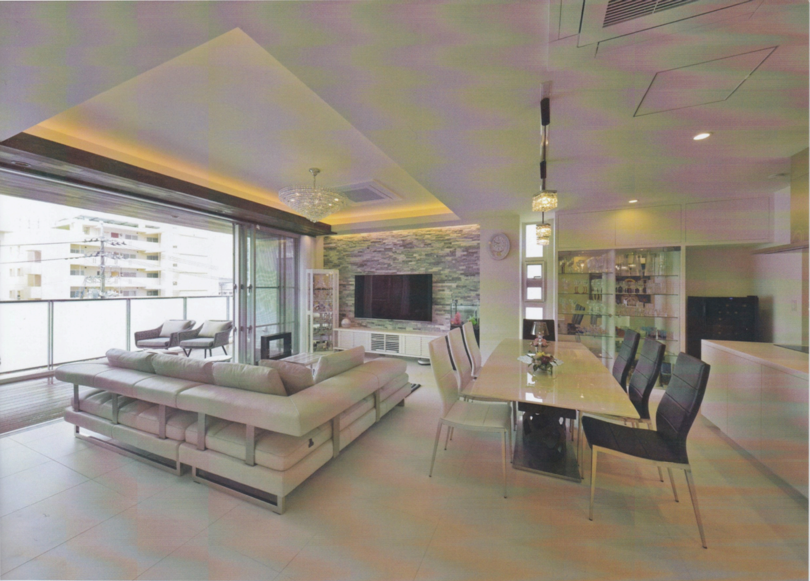
お客様が訪れた際にはパーティールームとなるように設計されているリビングルーム、大きく開口する窓が開放的な空間を演出する